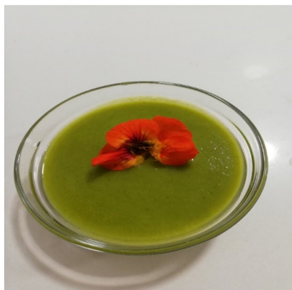
Figure 1 - Vegetable soup containing 14 g of nasturtium flowers with their stems.

Esta espécie é utilizada na medicina popular, para o tratamento de diversas doenças. Suas folhas são usadas para tratar distúrbios cardiovasculares, infecções do trato urinário, asma e obstipação (4). Estudos pré-clínicos mostraram efeitos anti-hipertensivos e diuréticos (5,6) e ensaios in vitro usando células de cultura revelaram efeitos anti-adipogênicos de extratos de T. majus (7). Além disso, vários estudos toxicológicos (toxicidade crônica e subcrônica, toxicidade reprodutiva e genotoxicidade) foram já realizados e mostraram que infusões de T. majus e extratos aquosos são seguros (8,9). No entanto, o uso de altas doses de extratos hidroetanólicos não deve ser recomendado para homens em idade reprodutiva e gestantes, pois altas doses desses extratos (> 300 mg.kg) têm interferido na função reprodutiva e gestação dos animais (4,8-10), embora o pré-tratamento com extrato de álcool metanólico de T. majus forneça proteção contra a toxicidade sanguínea e hepática induzida por maleato de dietilo em ratos, sendo esses resultados confirmados por exames histológicos (11). Nos últimos anos, a flor de T. majus tem sido amplamente utilizada na culinária como planta alimentícia não convencional (PANC) para decorar