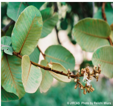
Figure 3 - Leaves of Neocarya macrophylla (Sabine) Prance ex F.White (Chrysobalanaceae); Source: JIRCAS photo by Rellchi Miura