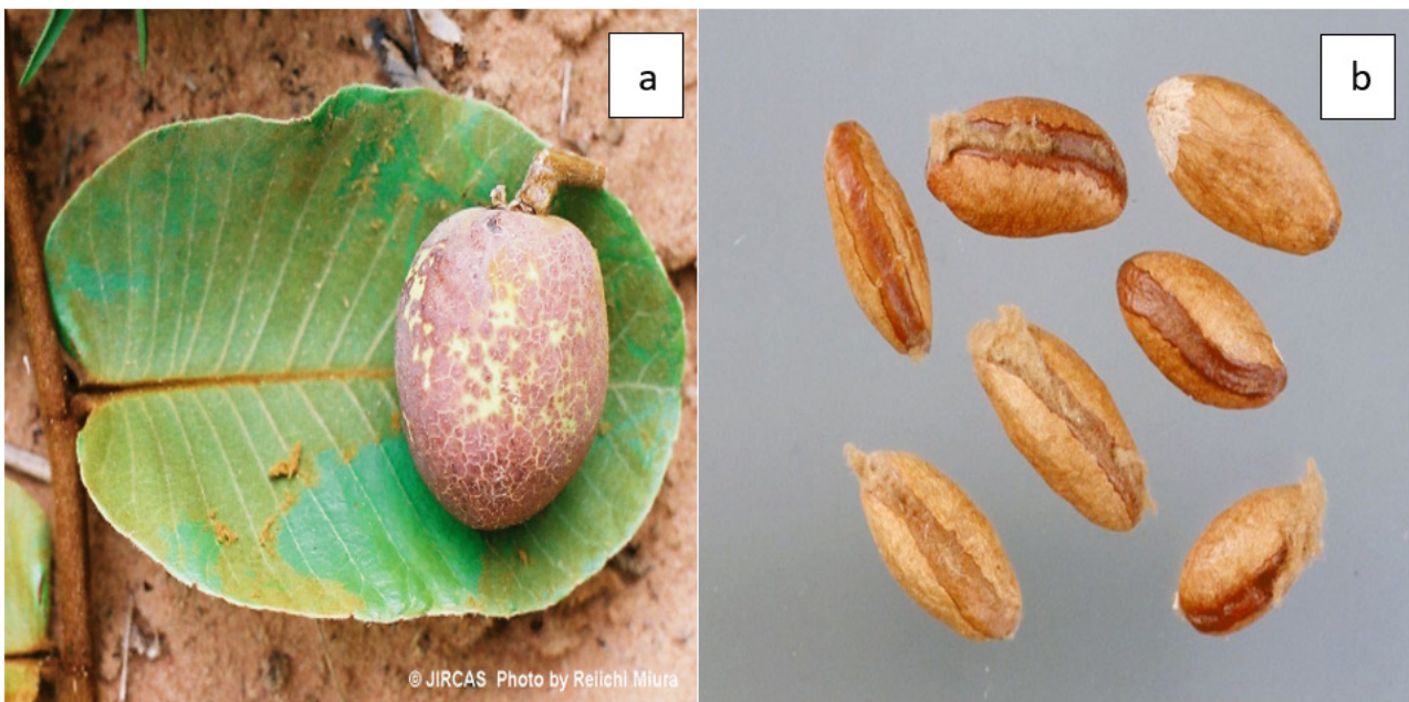
Figure 2 - Fruit (a) and seeds (b) of Neocarya macrophylla (Sabine) Prance ex F.White (Chrysobalanaceae); Source: JIRCAS photo by Rellchi Miura

N. macrophylla é um arbusto ou uma pequena árvore que cresce até 6 - 10 m de altura. Tem geralmente um tronco com ramos curtos e retorcidos com uma coroa aberta (4). O fruto (Figura 2) é uma drupa elipsoide, glabra, castanho-amarelada com verrugas cinzentas na superfície e tem 4 - 5 cm de comprimento e 2,5 - 3,5 cm de diâmetro com um caroço duro envolvido por uma polpa espessa. A casca é fissurada ou rugosa e tem um aspecto espesso e quebradiço, com barras pretas e vermelhas. Os caules são densamente pubescentes de cor castanho-avermelhada. A planta tem estípulas que são lineares nas axilas foliares.