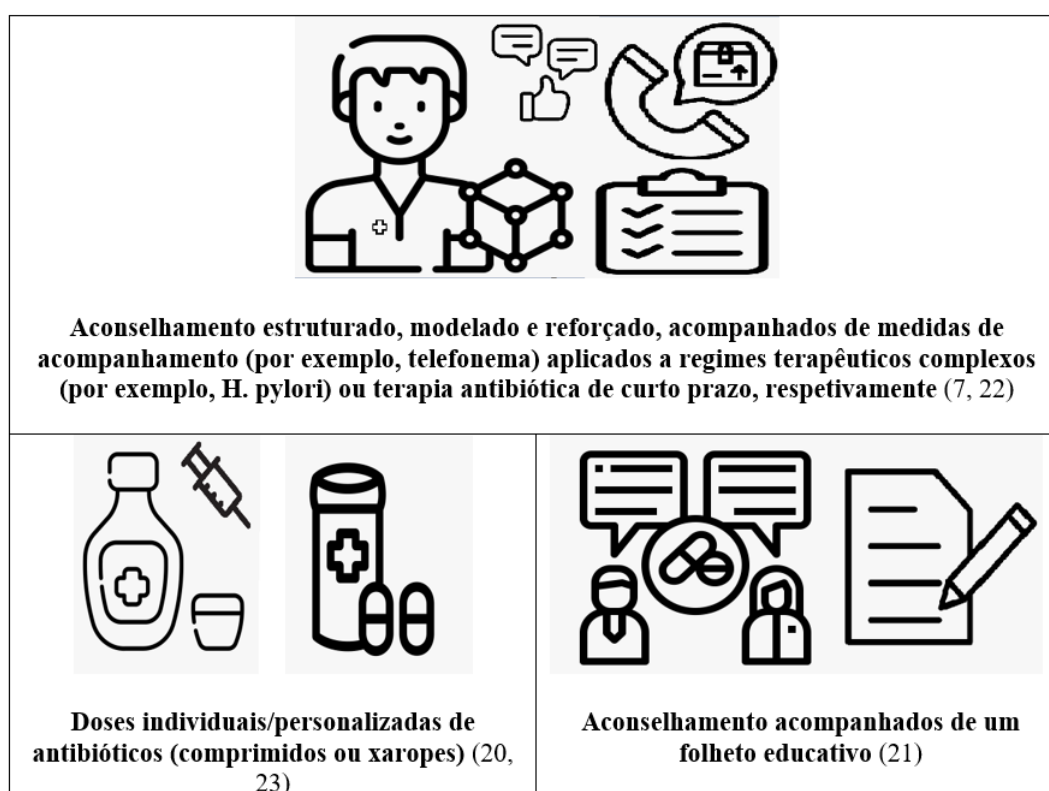
Figura 1 - Intervenções dos farmacêuticos eficazes na adesão dos doentes de acordo os estudos citados (controle vs. intervenção) ( p < 0,001 ).